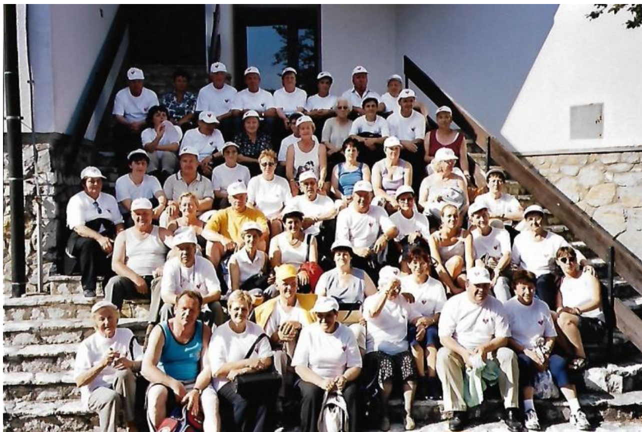
Srečanje vseh Koronarnih društev Slovenije v Sevnici

Društvo je bilo na začetku zelo aktivno. Veliko se je povezovalo z drugimi koronarnimi društvi, v letu 2002 so se udeležili srečanja v Sevnici.