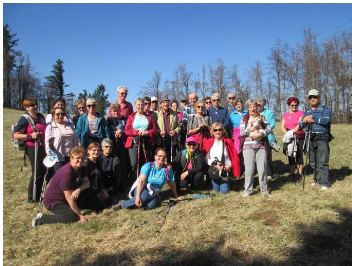
Pohod po srčkovi poti na Mačkovcu 31.3.2019