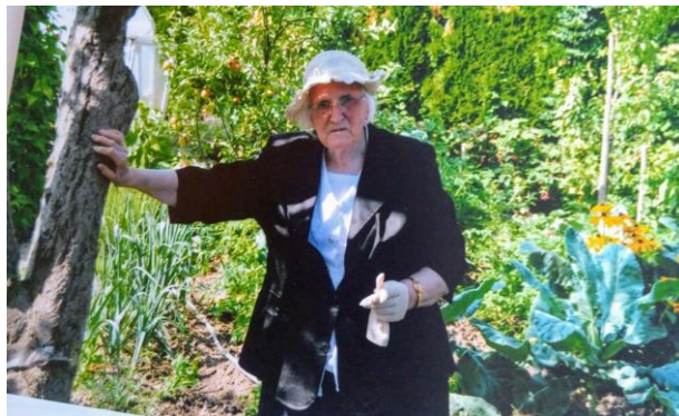
Telovadka Rada praznovala 99 let!