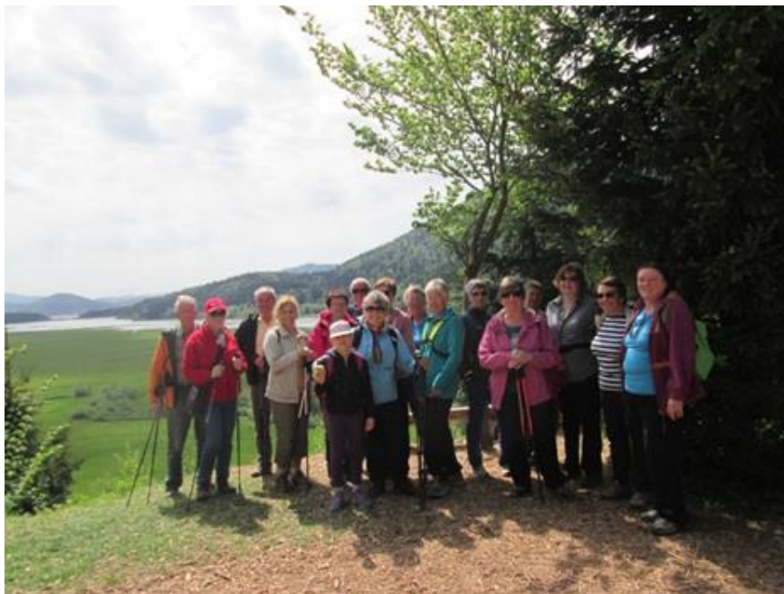
Pohod okoli Cerknjškega jezera 12.6.2018

Nadalje mesečno organiziramo pohode. Na njih smo se povzpeli na vse bližnje vrhove: Vremščico, Kokoško, Osojnico, Primož, Sveto Trojico, Šilentabor, Sovič, Sveto Katarino pri Novokračinah. Večkrat smo se podali na Kras, v Pliskovico, prehodili smo poti »od kala do kala«, in od »pastirske hiške do hiške«, spoznali okolico Filipčjega brda in prehodili dolino Glinščice. Udeležili smo se maratona treh src v Radencih, poleg tega smo večkrat prehodili Srčkovih poteh v Postojni in Ilirski Bistrici, pešpoti v okolici Prestranka in Postojne; pot okrog Cerknjškega jezera, podali smo se do izvira Sušca v Ilirski Bistrici in si ogledali stari del mesta, tako imenovano »Sibirijo«, in staro mestno jedro Majlont v Postojni. Seveda so se marsikateri pohodi ponavljali, to je bilo odvisno od vremena in letnega časa.