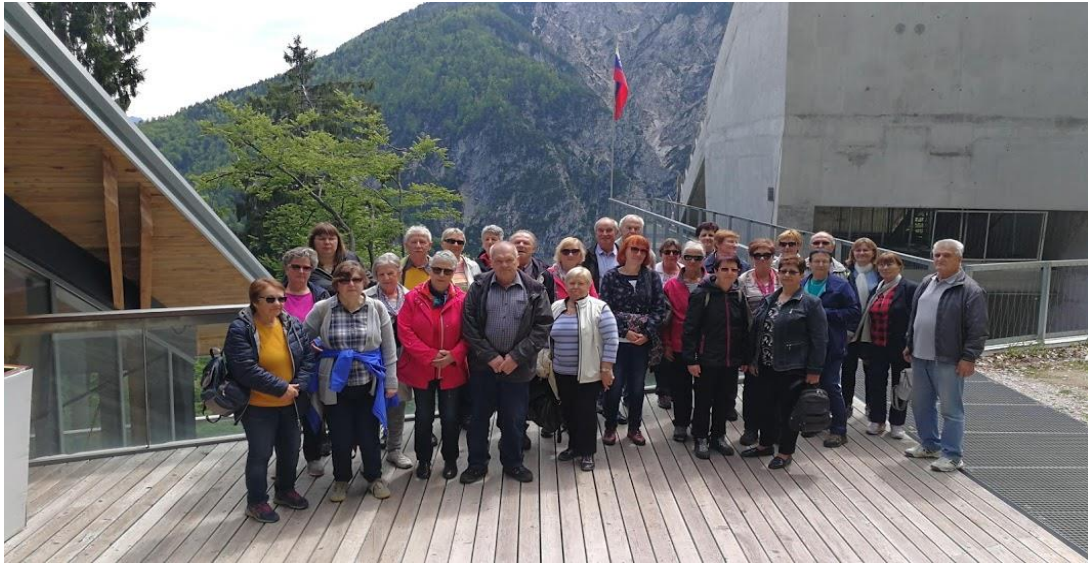
Izlet v Planico, Vrbo in Radovljico 5.6.2019