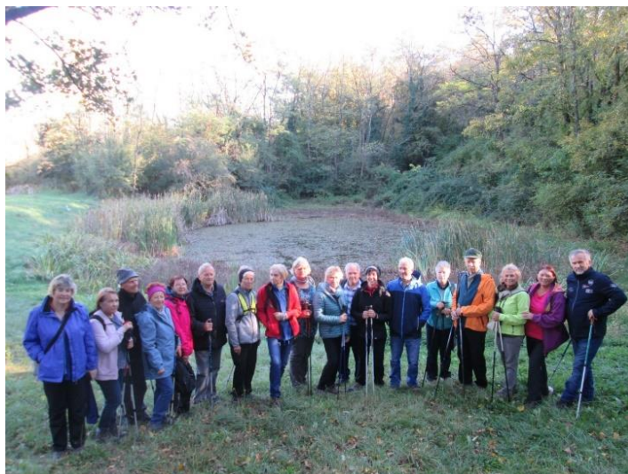
Pohod po Pliskini poti "od kala do kala" 2.10.2018