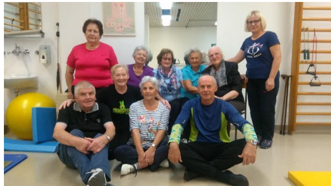
Telovadna skupina Postojna

V finačno boljših časih nam je bila omogočena brezplačna kontrola vrednosti maščob in sladkorja v krvi. Telovadno sezono vsako leto zaključimo s piknikom v naravi.