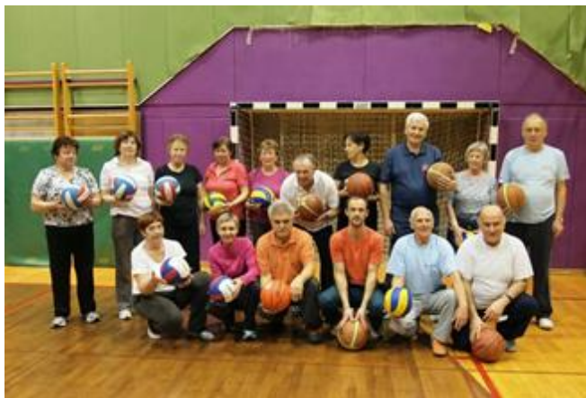
Telovadna skupina Postojna OŠ Miroslava Vilharja

V glavnem je naša pretežna dejavnost telesna vadba, ki poteka pod strokovnim vodstvom in nadzorom dvakrat tedensko v 5 skupinah, in sicer v Pivki, Postojni in Prestranku. Pri tem uporabljamo različne telovadne rekvizite, kot so žoge, palice, uteži, elastični trak; na razpolago smo imeli tudi sobno kolo.