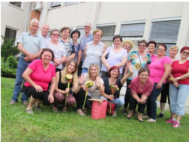
Zaključek telovadne sezone v Pivki 31.5.2018