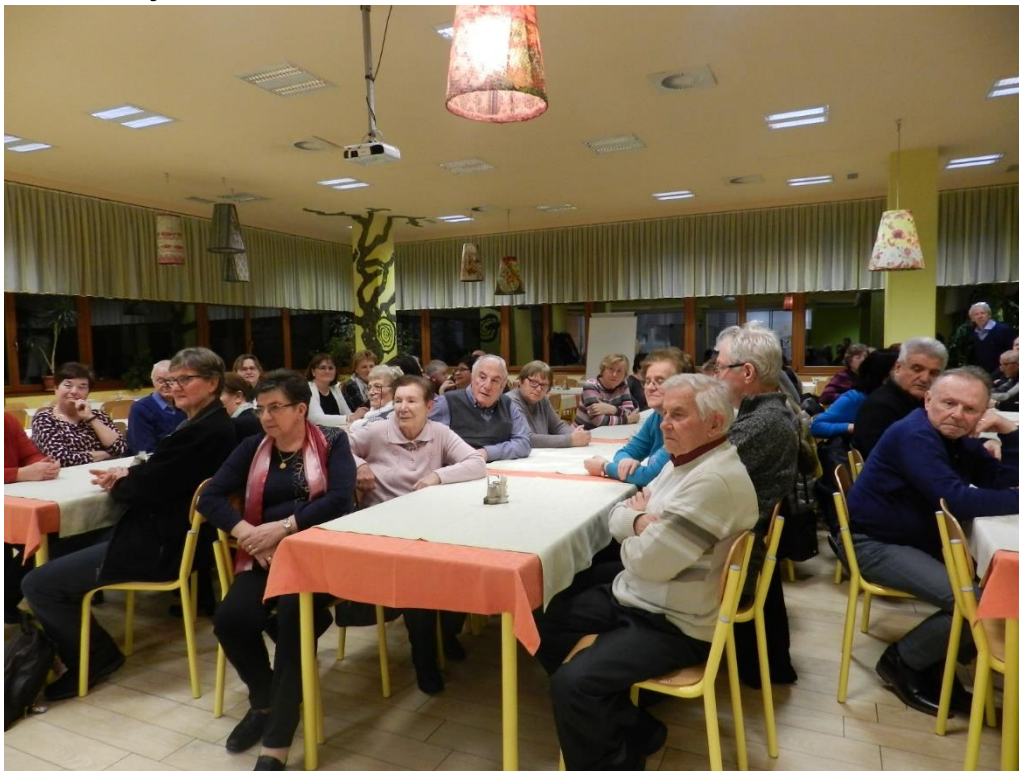
Občni zbor 2019

f/ Vsako leto se udeležujemo Občnega zbora, na katerem nam poleg podanih podatkov o poslovanju in sprejemu zaključnega računa organizirajo še prijetno družabno srečanje.