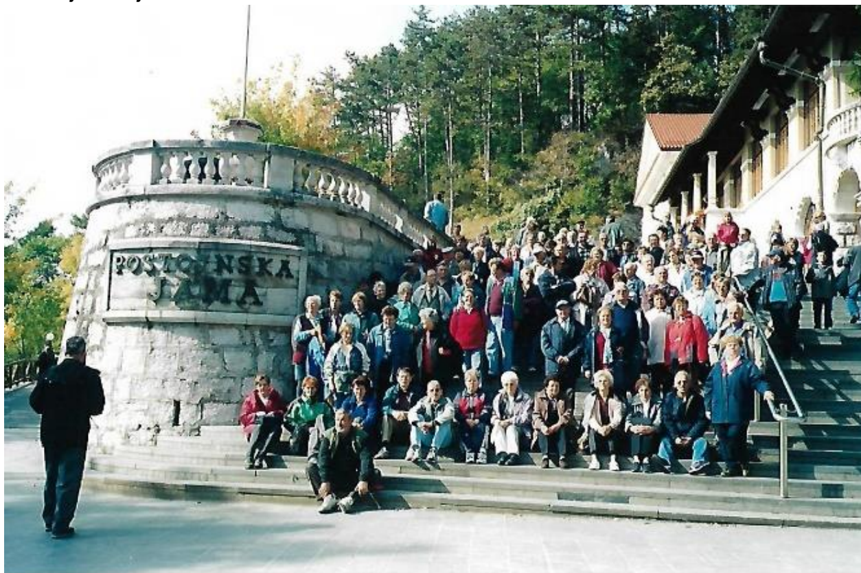
Srečanje vseh Koronarnih društev in klubov Slovenije v Postojni 5. 10. 2002

Največje vseslovensko srečanje, ki ga je društvo organiziralo, je bilo 5. oktobra 2002 v Postojni. Organizirana sta bila pohod po Srčkovi poti in ogled Postojnske jame.