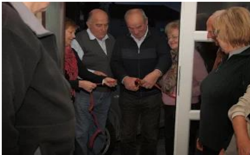
Odprtje pisarne na Jenkovi ulici 3

Omogočil nam je opravljati administrativne posle v prostorih njegove ambulante, vse dokler nismo dobili pisarne v 2. nadstropju Zdravstvenega doma. Kasneje nam je Občina Postojna ponudila prostore za sodiščem na Jenkovi ulici 3.