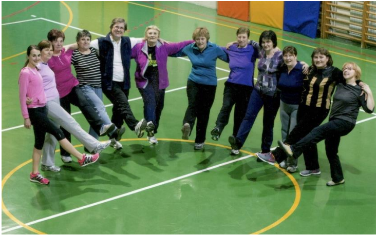
Telovadna skupina Prestranek

Za delovanje in spremljanja zdravstvenega stanja članov je društvo razpolagalo tudi z merilci krvnega tlaka in tehtnico. Redno izvajamo meritev krvnega tlaka in srčnega utripa.